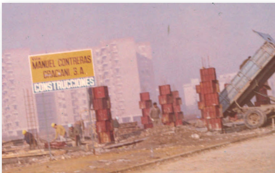
Obras de edificación, 1972

Crecíamos, era nuestro objetivo. Pero ese crecimiento también implicaba viajar mucho y estar fuera de casa toda la semana. Y viajar en aquellos tiempos no era tan fácil y rápido como es ahora.