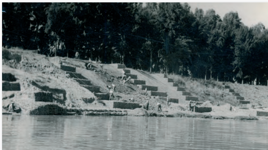
Defensa de gaviones en el Guadalquivir, 1949

La empresa, con su mismo nombre, fue la semilla de Azvi y del Grupo empresarial que tenemos hoy.