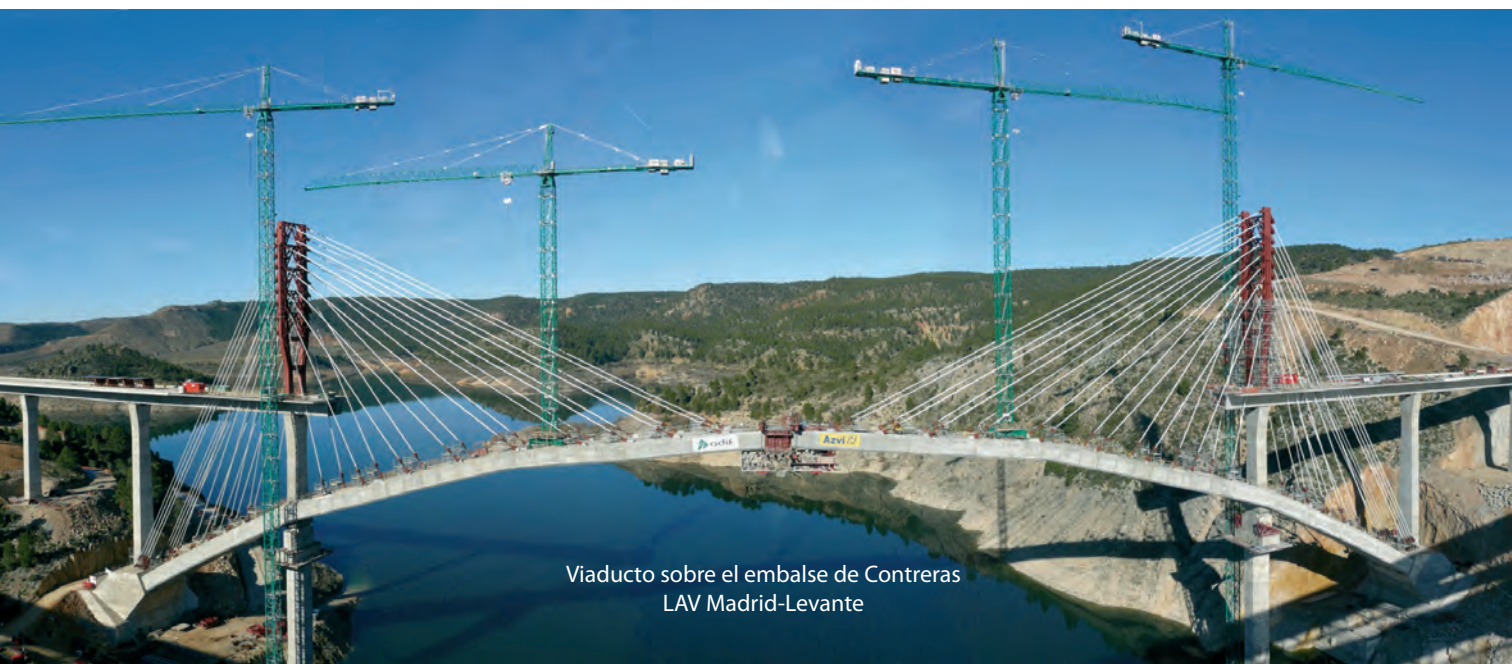
Viaducto sobre el embalse de Contreras LAV Madrid-Levante

En definitiva, un gran trabajo de todos los que formamos parte de esta Casa.