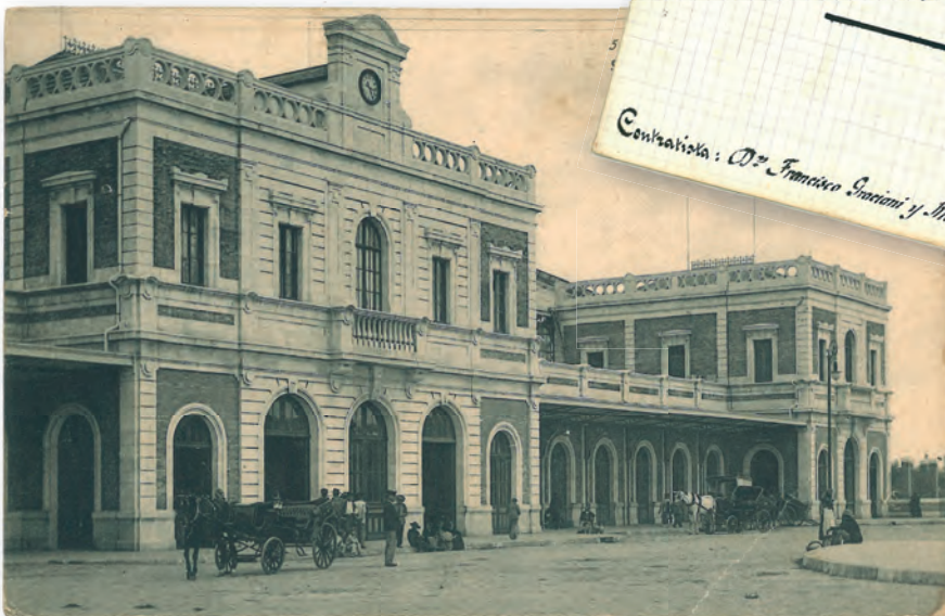
Contrato para la construcción de la Estación de S. Bernardo, en Sevilla, fechado en julio de 1901