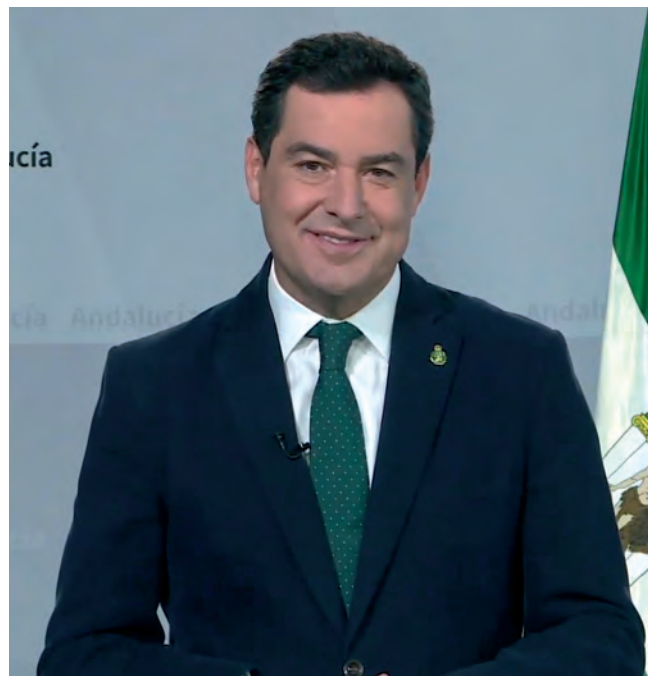
Juan Manuel Moreno Presidente de la Junta de Andalucía