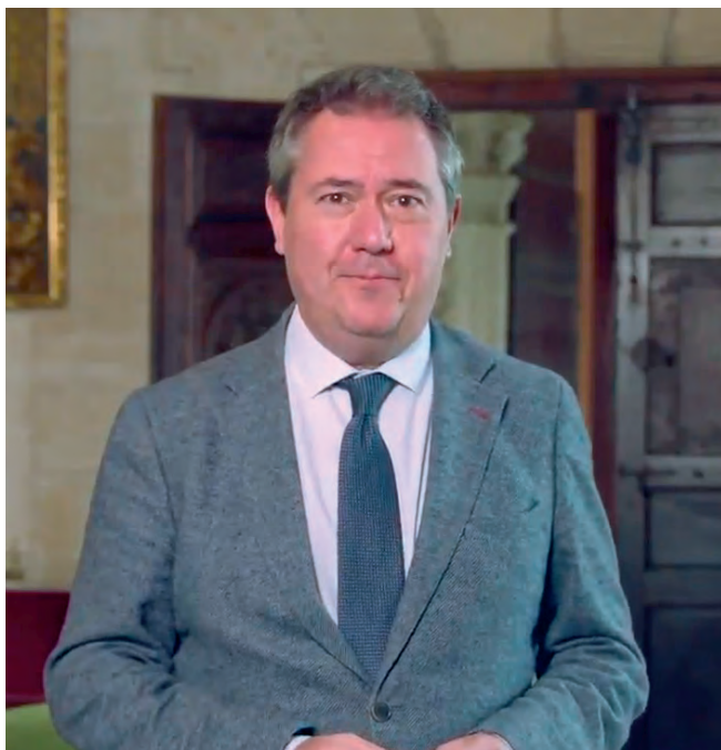
Juan Espadas Alcalde de Sevilla