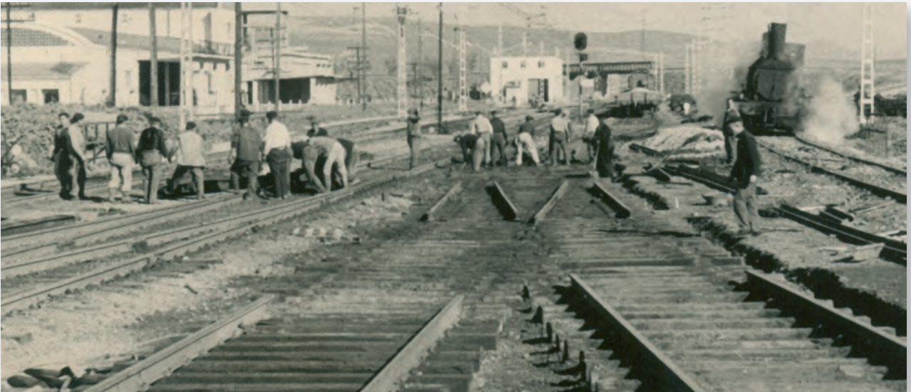
Reparaciones en cambios. Estación de Espeluy, 1959

Desgraciadamente, mi padre falleció joven, a los 58 años, en 1962. Yo tenía 22.